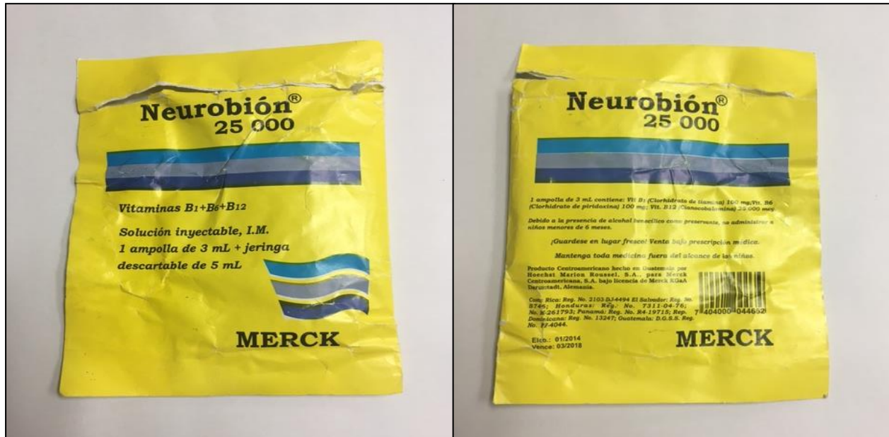
Imagen N° 2. Fotografías de la bolsa del Neurobiión falso

De acuerdo a la investigación realizada en conjunto con la oficina OCN INTERPOL del Organismo de Investigación Judicial, el paciente compró el medicamento falso a unas personas nicaragüenses que pasaron por su casa en Buenos Aires de Puntarenas ofreciendo zapatos y otros productos.